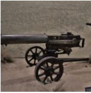
Russki ciężki karabin maszynowy Maxim nr. 1910 kal. 7,62 mm na podstawie kolowej Kolesnikowa Russian M1910 Maxim heavy machine gun, cal. 7.62 mm, on a wheeled Kolesnikov mount