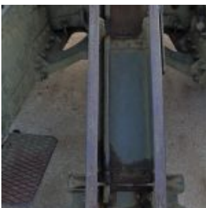
Czechy, Hrabyne – Národní památník II. světové války