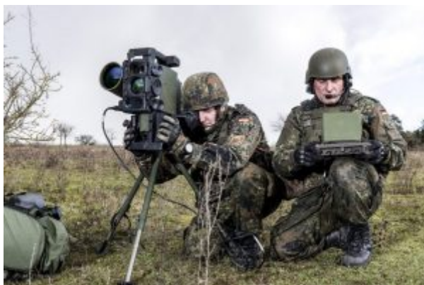
W służbie niemieckiej Bundeswehry

Układ napędowy: składa się z silnika startowego i marszowego. W każdym z pocisków silniki różnią się od siebie wielkością ładunku stałego paliwa raketowego, rozmiarami, czasem pracy i siłą ciągu odpowiednio do masy pocisków i ich zasięgu. Początkowo pocisk napędzany jest silnikiem startowym, a po oddaleniu się od operatora włącza się główny silnik marszowy, pracujący aż do uderzenia w cel.