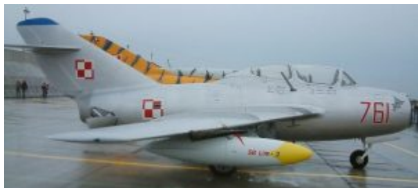
WSK SB Lim-2

pierwszych osiem dwumiejscowych UTIMiG-15 i SBLim-2. Na początku 1993 r. cztery z nich ponownie znalazły się w powietrzu. W 2006 r. w kolekcji Fundacji "Polskie Orły" znajdowały się samoloty Lim-2 i SBLim-2. Celem Fundacji jest przywrócenie obu maszyn do stanu lotnego i ich prezentacja w powietrzu na pokazach.