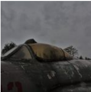
Lim-5 – Muzeum Lotnictwa Polskiego

W styczniu 1954 roku oblatano samolot SP-7F, wyposażony w silnik WK-1F. Skierowany został do produkcji pod nazwą MiG-17PF. Uzyskano wzrost osiągów i poprawienie właściwości manewrowych. Obok celownika radiolokacyjnego RP-1 stosowano jego udoskonalony wariant RP-5, z powiększonym zasięgiem i zwiększoną odpornością na zakłócenia. Dwie wytwórnie w ZSRR zmontowały 668 MiG-17PF.