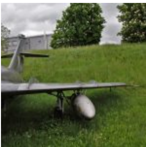
Lim-5R – Muzeum Lotnictwa Polskiego

Wersja Lim-5M miała dodatkowe owiewko zbiorniki zabudowane symetrycznie pod skrzydłami w części przykadłubowej. W owiewce wykonanej z laminatu część przednią wykorzystano na zbiornik, a tylna mieściła komorę podwozia głównego. W Lim-6 skrzydło jest takie samo, jak w Lim-5, a w Lim-6bis ma pod każdą