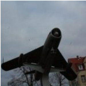
Pomnik "Na chwałę polskich lotników i kosmonautów" w Wołowie (Dolnośląskie)

Lim-6bis zaczęto przekazywać lotnictwu wojskowemu w marcu 1963 roku. Początkowo były to zmodyfikowane Lim-6, następnie trafiły do przeróbki Lim-5M. Kolejne 70 sztuk Lim-6bis było nowymi samolotami, których produkcję ukończono w 1964 roku. Część z nich wykonano w wersji rozpoznawczej, nazwanej Lim-6bisR.