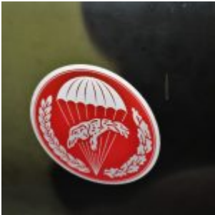
Poznań – Muzeum Broni Pancernej – nosiciel 82 mm działa bezodrzutowego B-10

Zmiana nazwy z wersji 469B na 31512 nie była nagła, gdyż samochód ten był systematycznie modernizowany od 1980 roku. Za istotniejsze nowinki techniczne, w porównaniu z wcześniejszym modelem, należy uznać za: nowy, mocniejszy stelaż, nieco mniejszą chłodnicę, systematycznie modernizowane gaźniki z typów od K126g do nowszych modeli K151, serwo-wspomaganiem hamulców, hamulce tarczowe, nowy okrągły kolektor ssący, mosty zwolnicowe (tzw. „afgany”, nieznaczne zmiany blacharskie w karoserii wozu, podwieszane pedały, sprzęgło hydrauliczne oraz wydajniejszą nagrzewnicę.