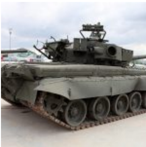
Detale T-80BW (T-80БВ):