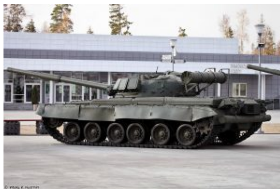
T-80 (wersja podstawowa)

Projekt powstał w biurze konstrukcyjnym Zakładów Kirowskich w Leningradzie. Był pierwszym na świecie seryjnie produkowanym czołgiem wyposażonym w turbinę gazową. Pierwszy egzemplarz zjechał z linii montażowej w 1976 roku. T-80 produkowany jest nadal w zakładach w Omsku w Rosji i Charkowie na Ukrainie. Czołg jest konstrukcją opartą na czołgu T-64 (bez użycia jako projektu bazowego czołgu T-72).