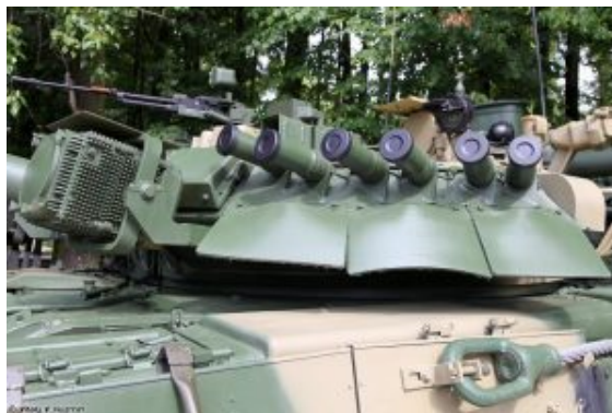
Wieża czołgu T-80UK, po lewej stronie jeden z emiterów podczerwieni (OTSzU-1-7)

Czołg może być wyposażony w system ochrony (system zakłóceńowy przeciwpancernych pocisków rakietowych) Sztora.