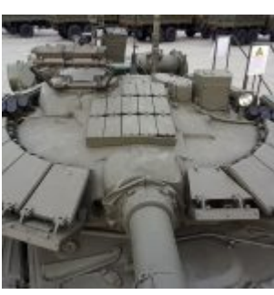
Detale T-80U (T-80Y):