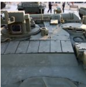
Detale T-80UE-1 (T-80YE-1):