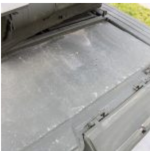
Detale T-80BWM (T-80БВМ) :