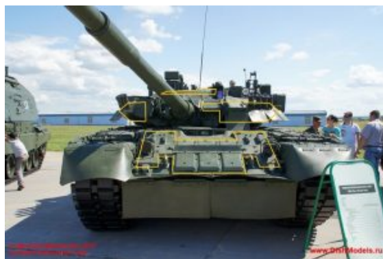
Na rysunku oznaczono umiejscowienie Kontakt-5