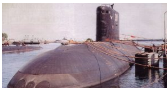
ORP Orzeł, 1993 rok

Opracowany w biurze konstrukcyjnym Rubin, z napędem diesel-elektrycznym, z jednym wałem napędowym i jedną śrubą. Generatory elektryczne sprzężone z silnikami wysokoprężnymi wytwarzają energię elektryczną, która zasila pojedynczy silnik elektryczny w trakcie pływania na powierzchni lub przy użyciu chrap. Energia elektryczna ładuje także akumulatory, które zasilają silnik elektryczny w trakcie pływania podwodnego. Kilo wyposażony jest w sześć dziobowych wyrzutni torpedowych, z których dwie zapewniają możliwości wystrzeliwania torped sterowanych przewodowo. Automatyczny system przeładowczy