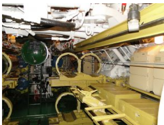
Przedział torpedowy. Widoczne wewnętrzne pokrywy wyrzutni, po prawej stronie podajnik automatycznego urządzenia

Budowa tych okrętów rozpoczęła się w trzech stoczniach – Komsomolsk na Dalekim Wschodzie, Sudomech w Leningradzie i w śródlądowej stoczni Krasnoje Sulino w Gorkim. Okręt wiodący – B-248 – został zbudowany w Komsomolsku i wszedł do służby w radzieckiej marynarce 12 września 1980 roku, Do rozpadu Związku Radzieckiego w 1991 roku w Komsomolsku zbudowano 13 jednostek i 9 w Gorkim. Począwszy od czternastej jednostki, zwiększono długość okrętów w celu instalowania ulepszonej maszynowni.