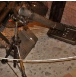
Muzeum Armii Poznań