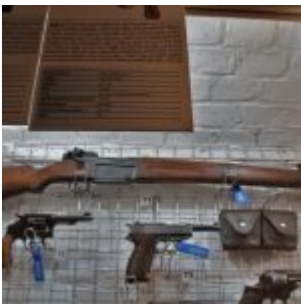
Ekspонат ze zbiorów: Fort Gerharda – Muzeum Obrony Wybrzeża, Świnoujście, Polska