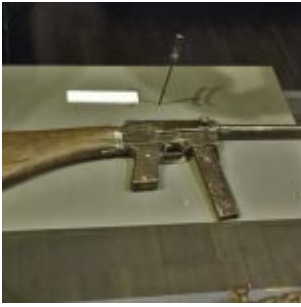
Dwa egzemplarze MAS 38 z Muzeum Wojska Polskiego, Warszawa

Pistolet maszynowy MAS 38 był indywidualną bronią samoczynną. Zasada działania automatyki oparta o odrzut swobodny zamka. Strzelanie z zamka otwartego seriami. Oś zamka i sprężyny powrotnej odchyłona od osi lufy. Zasilanie z magazynków pudełkowych o pojemności 32 naboji. Broń była zabezpieczana przez przesunięcie języka spustowego do przodu. Lufa wkręcona w komorę zamkową zakończona podstawą muszki. Łoże i chwyt pistoletowy z bakelitu. Kolba drewniana, stała.