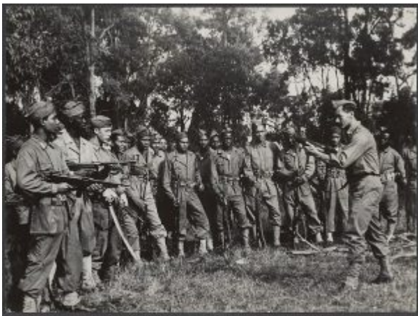
Papua-Nowa Gwinea, 1944 rok

Obawa rychłego przystąpienia USA do wojny spowodowało przeprowadzenie badań porównawczych z karabinami Garand M1 oraz Springfield M1903 w 1940 roku, a następnie złożenie we wrześniu 1941 roku zamówienia na 100 egzemplarzy do testów operacyjnych przez Piechotę Morską USA (US Marine Corps). Broń tego typu trafiła na wyposażenie kilku amerykańskich jednostek do zadań specjalnych (m.in. Raiders Marine). W 1944 roku powstała nowa wersja broni, która nie była dalej rozwijana.