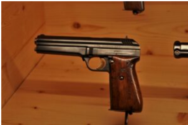
Model CZ vz.29 V