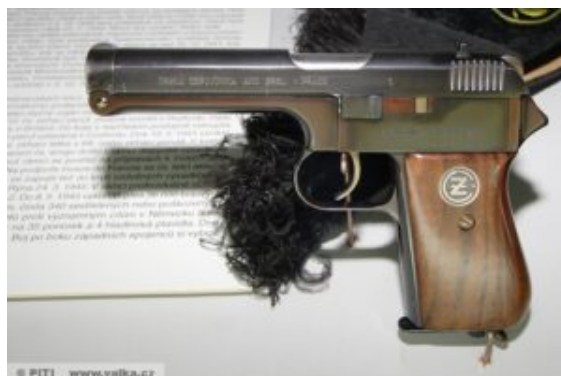
SN: 1. Na boku má ražení: "STRAKONICE KVĚTEN 1937"

Zastosowano celownik szczerbinkowy ze stałą nastawą na odległość 50 m, współpracujący z muszką umieszczoną nad wylotem lufy. Okładziny rękojeści drewniane.