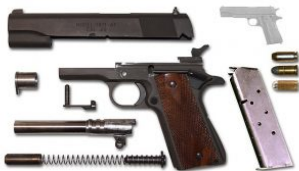
Rozłożony Colt M1911A1

Jednak podczas trwania produkcji, dawały o sobie znać powstające problemy społeczne. W kilku fabrykach zbrojeniowych podczas lata i jesieni 1918 roku doszło do strajków. Interweniowała rządowa Narodowa Rada Wysiłku Wojennego, która doprowadziła do arbitrażu i rozstrzygnięcia sporów płacowych w większości po myśli strajkujących robotników. To oczywiście spowodowało wybuch kolejnego strajku, tym razem robotników, którzy wcześniej nie brali udziału w strajku i nie objęły ich korzystne arbitraże. Rząd ostatecznie stracił cierpliwość i 13 września 1918 roku prezydent Stanów Zjednoczonych Woodrow Wilson zażądał natychmiastowego zakończenia strajku pod groźbą wprowadzenia militaryzacji przemysłu wojennego. To oczywiście poskutkowało i już nazajutrz strajk się zakończył.