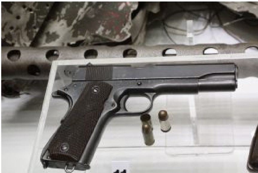
Pistolet samopowtarzalny Colt M1911A1

dodatku sam nabój okazał się za słaby. Sama wojna z Hiszpanią jednak nie pokazała tych wad, a dopiero jej skutki, które nastąpiły po kilku latach czy kilkunastu latach po jej zakończeniu. Efektem wygranej wojny z Hiszpanią, gdzie większość broni strzeleckiej strony hiszpańskiej górowała technicznie nad stroną amerykańską, tak w karabinach piechoty, broni maszynowej czy broni krótkiej. Ale lepsza logistyka, jak i taktyka oraz przewaga liczebna wsparta siłami partyzanckimi/powstańczymi działającymi na tyłach hiszpańskiej armii. Zajęto tym samym Kubę oraz Filipiny, jednak brak niepodległości oraz co pokazał czas, zamianą jednego kolonizatora na drugiego, chociaż mniej opresyjnego, zaczęły wybuchać bunty, które pokazały najgorsze wady broni krótkiej.