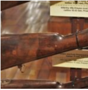
11 mm Karabin iglicowy Chassepot Mle 1866