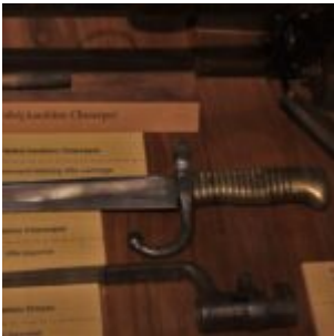
Bagnet Mle 1866