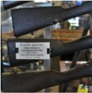
11 mm Karabin iglicowy Chassepot Mle 1866