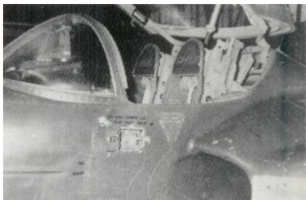
Kabina pilotów samolotu Cessna A-37B. ITWL, 1978 rok

postawione nowemu samolotowi. Zasięg samolotu został powiększony dzięki zbiornikom paliwa zamontowanym na końcówkach skrzydeł. Wszystkie zbiorniki paliwa zostały protektorowane (zabezpieczenie przed wyciekiem w wypadku przestrzelenia).