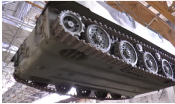
Spód pojazdu, widoczne chrapy pędników wodnych.