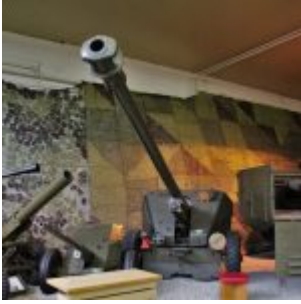
Vojenské Historické Múzeum, Piešťany, Słowacja

Projekt i rozwój vz.53 rozpoczęto w 1948 roku w zakładach Škoda w Pilźnie pod firmowym oznaczeniem A20. Problemy z konstrukcją amunicji doprowadziły do zaprzestania produkcji w 1950 roku. Dopiero w 1953 roku problemy zostały rozwiązane i wznowiono rozwój z oznaczeniem vz.53. Vz.53 został zaprojektowany do pełnienia tych samych funkcji co radzieckie działo polowe 100 mm M1944 (BS-3) i używał tej samej amunicji. Jego osiągi były podobne do osiągnięć M1944, ale ponieważ był to unikalny projekt, miał inne wymiary. Do walk nocnych mógł być wyposażony w celownik noktowizyjny na podczerwień.