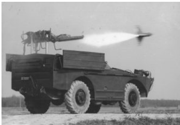
Samobieżna wyrzutnia 2P27

Lata 60. XX wieku to dla sił lądowych, ogólnowojskowych związków taktycznych czas, kiedy trwały nieustanne zmiany organizacyjne i wprowadzania do eksploatacji nowych rodzajów uzbrojenia i specjalistycznego wyposażenia. Jedną z nich miały być wyrzutnie systemu 2P27 – 2K6 Trzmiel, z przeciwpancernymi pociskami kierowanymi typu 3M6. System ten był pierwszym wprowadzonym do seryjnej produkcji tego typu w Związku Radzieckim oraz następnie w państwach należących do Układu Warszawskiego, w tym Polski.