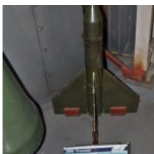
Kraków, Muzeum Lotnictwa Polskiego