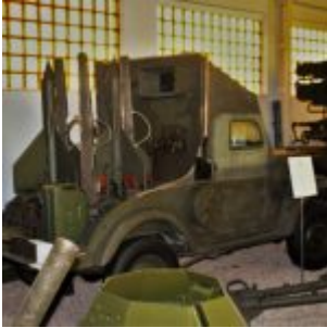
Samobieżna wyrzutnia 2P26