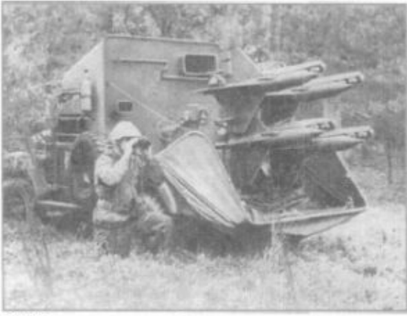
BM2126 в готовности к стрельбе

Mimo posiadanych oczywistych wad jak stosunkowo duża „martwa strefa”, pociski rakietowe 3M6 „Trzmiel” były produkowane w bardzo dużych ilościach, jednakże też bardzo szybko się zestarzały. Znalazły się na wyposażeniu wielu krajów „zaprzyjaźnionych” ze Związkiem Radzieckim, takich jak Chiny, czy Wietnam Północny, ale także u sojuszników Armii Radzieckiej, w tym Wojska Polskiego.