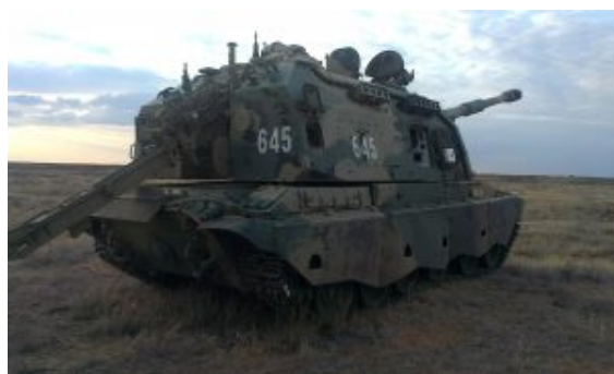
Tyłna część haubicy z rozłożoną prowadnicą do podawania amunicji z zewnątrz pojazdu

Nowatorskim posunięciem było opracowanie w Urałtransmaszu, równoległe z 2S19, jej trenażera, oznaczonego 2Ch51 Bunkierowka. Jest to wieża dział bez poszycia i lufy, ale ze wszystkim elementami wyposażenia wnętrza. Jest umieszczona na ramie o wysokości, takiej, jak wysokość nośnika, dzięki czemu można ćwiczyć podawanie amunicji z zewnątrz wieży. Trenażerem steruje się z umieszczonego obok pulpitu. Szkolenie na trenażerze znacznie obniża koszty przygotowania załóg, co jest tym bardziej istotne, że choć 2S19 jest znacznie bardziej skomplikowana konstrukcyjnie niż starsze radzieckie działa samobieżne, miała być produkowana masowo i być obsługiwana co najmniej częściowo przez żołnierzy służby zasadniczej.