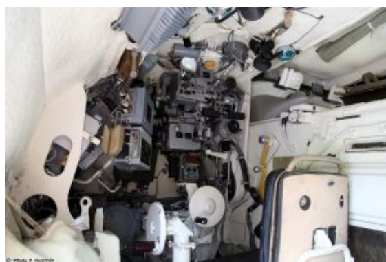
Stanowisko celowniczego 2S19M2.

Równocześnie konstruowano działo holowane 2A65 i przeznaczone do zabudowy w wieży 2A64. Działo holowane oraz system artyleryjski działa samobieżnego opracowywało od 1980 roku OKE-2 (obecnie CKE Titan) zakładów Earrikady z Wołgogradu, pod kierunkiem G. Siergiejewa. Koordynatorem prac nad działem samobieżnym, które otrzymało oznaczenie Obiekt 316 i indeks GRAU (Główny Zarząd Rakietowo-Artyleryjski) 2S19, a także projektantem nośnika, było KB Urałtransmasz w Swierdłowsku (dawniej i dziś – lekatierinburg), kierowane przez lu. W. Tomaszowa. W pracach uczestniczyło także Tulskie KE (obecnie NPO Tocznot'), które odpowiadało za przedział bojowy.