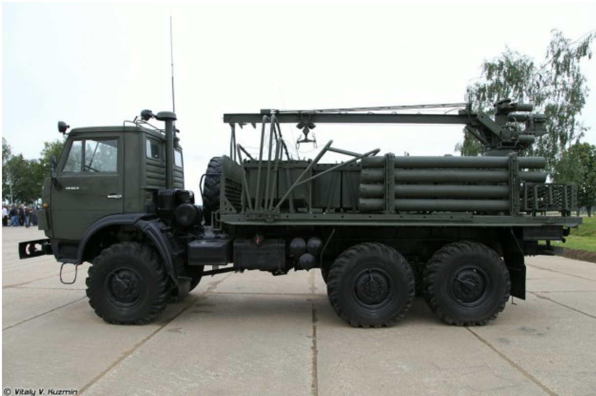
Pojazd transportowo-załadowczy 2F77

Kompleks obrony powietrznej Tunguska-M obejmuje wóz bojowy 2S6, wóz załadunkowy, zautomatyzowaną stację kontrolno-badawczą, a także zaplecze obsługowo-naprawcze.